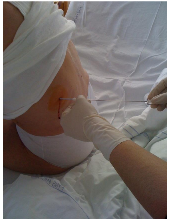
Eksempel på dræn og anlæggelse med henblik på udtømning af effusion.