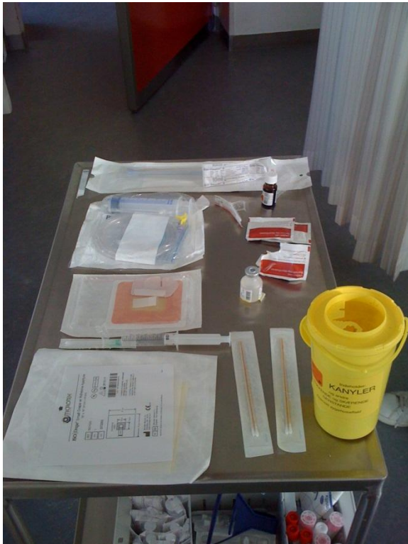
Eksempel på anretning før anlæggelse af mindre pleuradræn